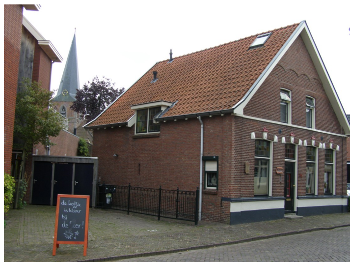
Het voormalige café 't Steertje in de Marktstraat.

In de Nieuwstadsstraat (nu de Marktstraat) lag een brug, zodat het verkeer zowel over de weg als over het water kon passeren. Deze brug heette de Smidbrug, Smidsbrug of Smitsbrug, alle drie de namen kunnen we tegenkomen in de literatuur. Deze naam