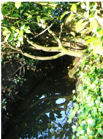
In een tuin tussen de Ennekerdijk en de Abraham ten Catestraat ligt bovengronds nog een klein stukje beek.

een tuin tussen Ennekerdijk en Abraham ten Catestraat kun je het kleine stukje dat nog over is van de oude Bornse Beek, via een rooster, ondergronds zien verdwijnen. Of eigenlijk is verdwijnen niet het goede woord: vanaf hier gaat de Bornse Beek ondergronds via een rioolbuizenstelsel richting het Kulturhus. Net zoals de oude beek via een rioolbuizenstelsel vanaf de Rondweg komt, tot voorbij de tuin van Galerie Polder.