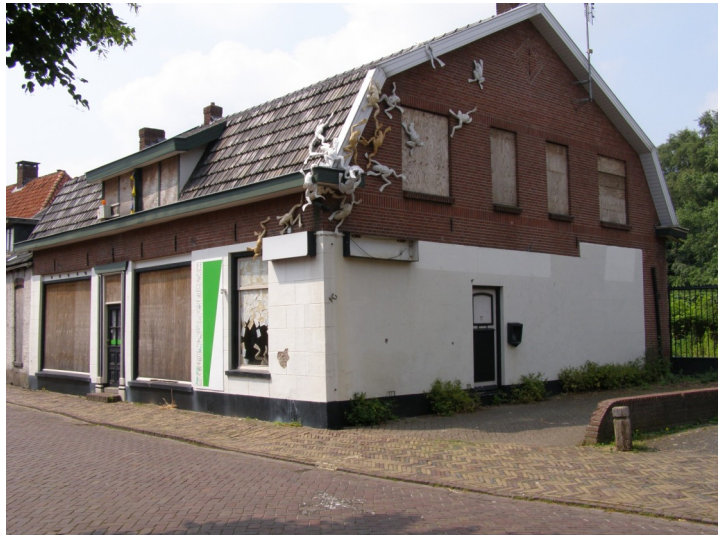
Het pand waar destijds café De Halve Maan en later electronica-zaak Hasperhoven gevestigd waren.

Overigens was het Steertje niet de enige