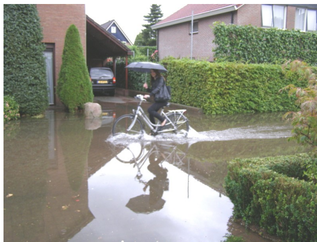
Na een dikke onweersbui kan het behoorlijk nat zijn. De Pinksterbloem staat blank.

Borne is ontstaan aan de oever van de beek op een hoog gelegen gedeelte (Horst), iets verder naar het zuiden dan de vindplaats van de mammoetbotten. Zo gebeurde dat vroeger. Voor vervoer waren er zandwegen die een deel van het jaar onbegaanbaar waren. In 1813 was er in heel Nederland maar 450 kilometer verharde doorgaande weg, in Twente geen enkele kilometer (3). Daardoor was vervoer