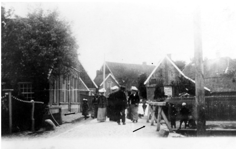
De Smitsbrug in de Nieuwstadsstraat. Links en rechts met pijlen aangegeven de brugleuningen. Links café 't Steerntje.

hield verband met de smid Hemmelder, die in het pand iets verder op, naast het Steerntje, werkte. In dat pand kwam veel later de ijzer- en gereedschaphandel firma Knoef. Een waardig opvolger, want ook ijzerwaren tenslotte. Nog weer later, tot voor kort, was er een modezaak in het pand. Helaas geen ijzeren harnassen. Inmiddels, medio 2016, staat het al weer te huur.