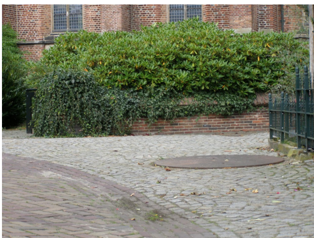
De put in de Oude Kerkstraat, hoek Pellenhof.

De Pietmanskolkstraat verwijst naar een verbreding, een kolk, die hier lag in de Bornse Beek. Waarschijnlijk konden hier schuitjes draaien en aanleggen. Er wordt ook gezegd dat de kolk gebruikt werd om vlas te weken en linnen te wassen (7b). Omstreeks 1835 werd er een dam door de Pietmanskolk gelegd, waarover de Peppelenlaan, de latere