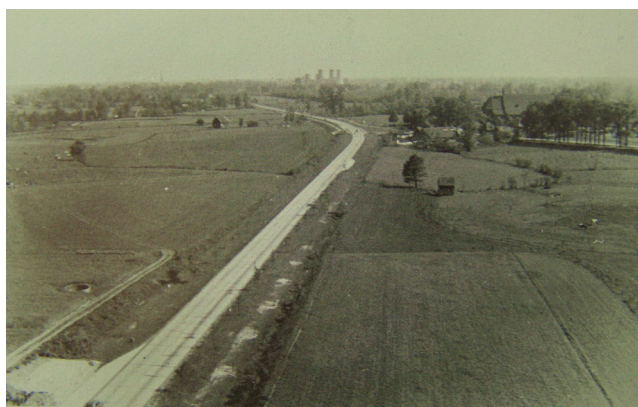
De kronkelige loop van de beek is met enige moeite nog terug te zien op deze foto.

Theresiakerk staat, splitste de beek zich. Het water dat uit de richting van Hengelo kwam ging grotendeels om Borne heen. Dat deel noemen we nu de Bornse Beek. Een smaller deel van de beek liep richting de Ennekerdijk, via de weilanden aan de zuidoostelijke rand van Borne, de Zuid Esch. Op een foto uit het boekje Borne en de Bornsen (7a) en op de kaart van Borne uit 1832 of 1900, is, met enige moeite, de kronkelige loop door de weilanden van de Zuid Esch te zien. De Zuid Esch was toen nog onbebouwd buitengebied. De Ennekerdijk was de oostgrens van het bebouwde Borne.