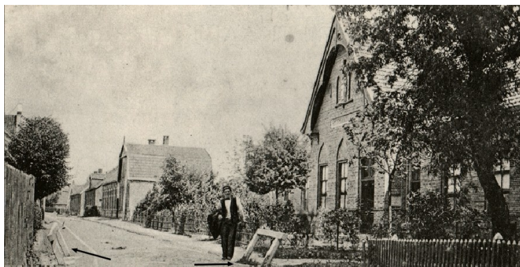
De Ennekerdijk in vroeger jaren. Rechts het St. Josephgebouw (nu Galerie Hallema). Op de voorgrond (met pijlen aangegeven) twee houten brugleuningen.

Op de Kadasterkaart uit 1832 (6) is duidelijk te zien hoe de beek zich door de Zuid Esch slingerde. Ter hoogte van waar nu de