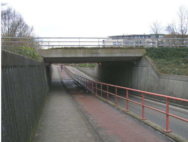
Viaduct 'de Sluis'

Rond het jaar 1660 is de beekbedding die we nu de Bornse beek noemen, om het dorp heen gegraven. Dit schijnt te zijn gebeurd tijdens het bewind van